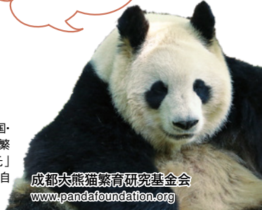
成都大熊猫繁育研究基金会 www.panda-foundation.org

私は中医学研究会の マスコット・冠元(かんげん) です。今年で19歳。 実は孫も2頭います